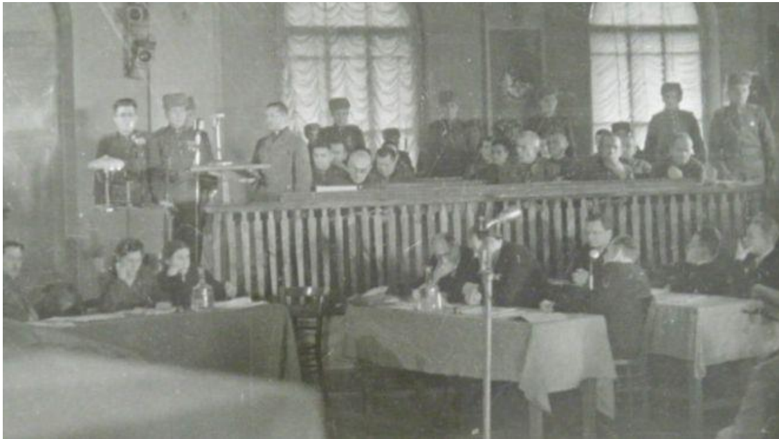
У судовій залі Будинку Червоної Армії (нині – Будинок офіцерів на вулиці Грушевського).

У судовому засіданні було доведено вину обвинувачених у здійсненні каральних операцій і масових убивств мирного населення на окупованій території, вивезенні місцевих жителів до концтаборів та на примусові роботи до Німеччини, руйнуванні житла, нищенні економіки, розкраданні культурних цінностей тощо. Судове засідання розпочалося 17 січня. Підсудні все заперечували. Але після виступів численних свідків – засідання тривало протягом 11 днів – стався перелом.