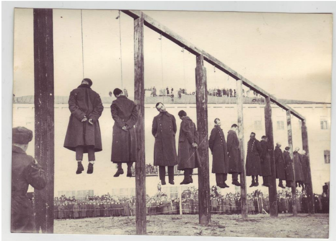
Страта нацистів на площі Калініна, м. Київ. 29 січня 1946 р.

У 1945-1946 роках процеси військових злочинців з подальшими публічними стратами проходили в різних регіонах країни – в Криму, Краснодарському краї, Україні, Білорусії. Були повішені 88 людей, вісімнадцять з них – генерали. Робота по виявленню таких злочинців тривала і надалі, але страчувати засуджених незабаром перестали.