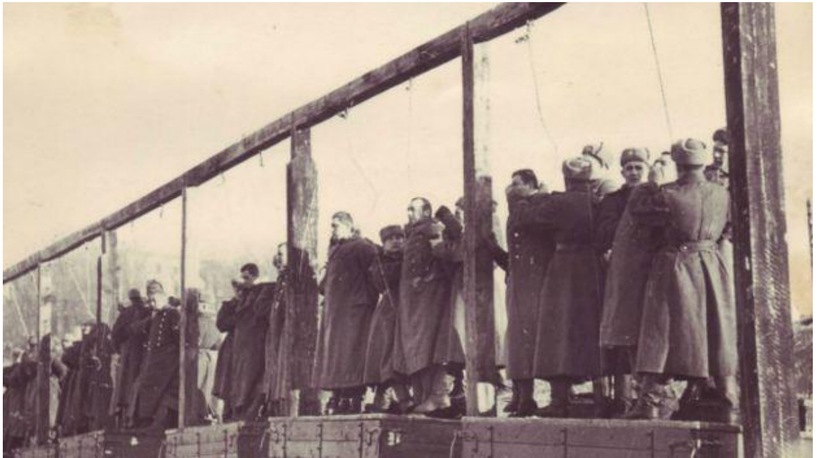
Страта нацистів на площі Калініна, м. Київ. 29 січня 1946 р.