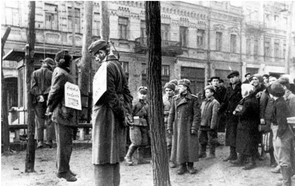
Страчені нацисти. Бульвар Т. Шевченка. Листопад 1943 р. 9

Загалом, між 1943 та 1953 рр. органами НКВС–НКДБ в Україні було звинувачено у співпраці з нацистами 93 590 осіб, що становить близько половини усіх заарештованих українськими органами НКВС за цей період. 8