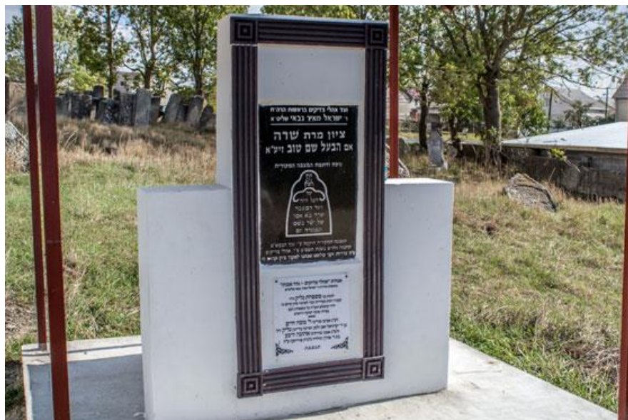
Могила Сари матері Беша.

Крапку в історії єврейської громади Тлустого поставила німецька окупація. Нацисти створили в містечку гетто, куди крім місцевих зігнали євреїв з сусідніх Заліщків, Городенки, Ягільниці, Чорткова тощо. 27 травня та 6 червня 1943 р. у наслідок двох масових страт все населення гетто було знищене. Враховуючи страти попередніх років, в містечку на загал закатували майже 5 тис. людей.