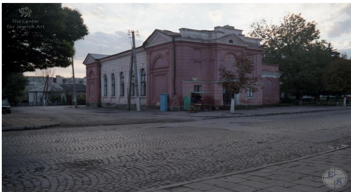
Будинок синагоги в Терешчівлі. Фото The Center for Jewish Art, 2000.

Гетто (літо 1942 – 5 червня 1943 рр.). 157 Тут перебувало єврейське населення з міста Терешчівля (1 тис. 700 осіб) та із сіл Янів, Струсів, Буданів Терешчівлянського району. Офіційно утворене 1 грудня 1942 р. відповідно до наказу начальника поліції СС на території Генерального губернаторства