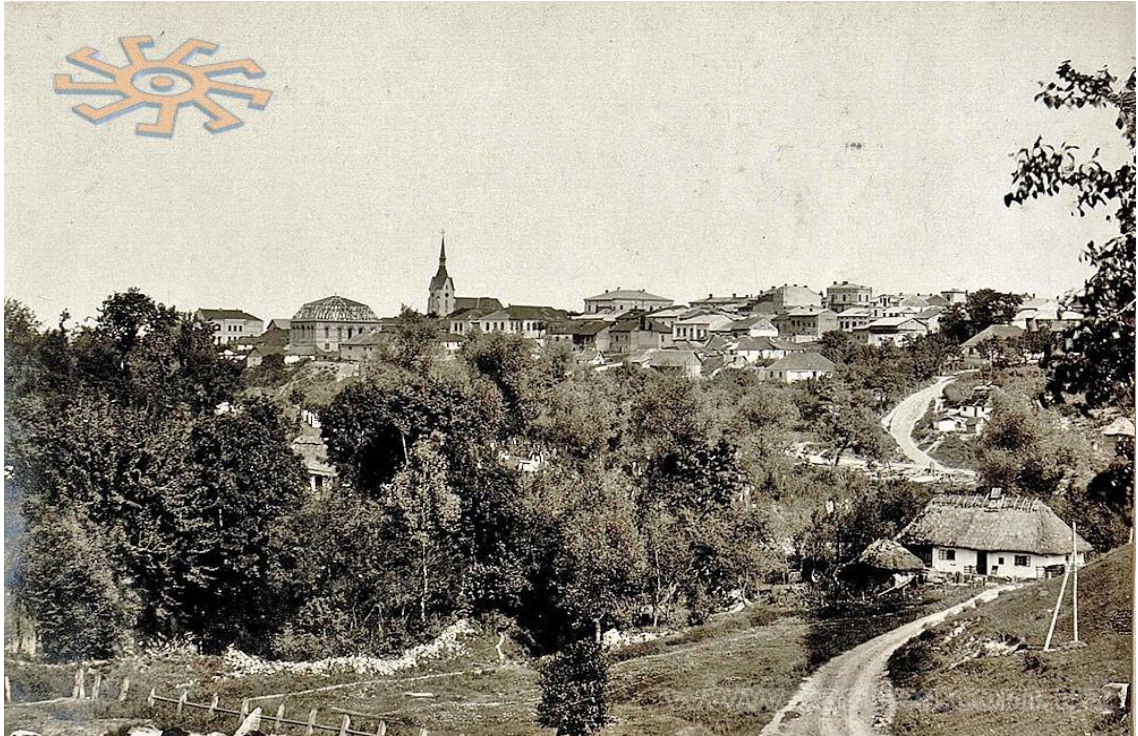
Панорама Скали-над-Збручем. Часи Першої світової війни.

До кінця 19 століття були організовані перші сіоністські групи. В 1908 була заснована школа "Саффа Брура" з викладанням на івриті, при ній діяла бібліотека. У 1911 р. засновано жіночу організацію "Рахель", що організувала драм. гурток.