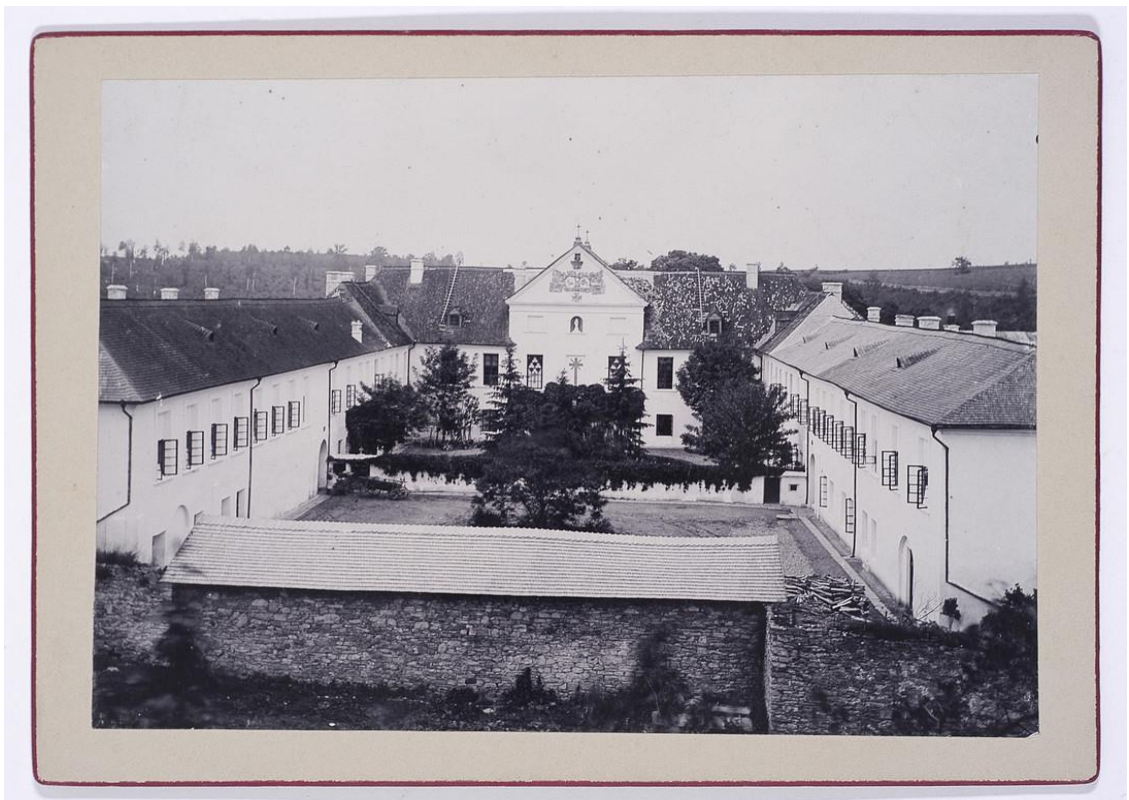
Палац в Язлівцю 1904 р.

У середині XV ст. Язловець був значним торговельним центром. Економічний розвиток міста зумовлювався зручним географічним розташуванням – сприяв торговельний тракт «Вія Регія», який сполучав Львів з Молдавією. Однак на початку 1460-х років львівські купці подали королю скаргу, що провінційні ярмарки (зокрема, в Язловці, Гологорах, Рогатині, Теревовлі, Тисмениці) дуже підривають львівську торгівлю. Король Казимир IV Ягеллончик видав розпорядження, яким ліквідував (зніс) ті ярмарки (зокрема, місцевий ярмарок – виданим 23 червня 1461 р. у Кракові документом), а воєводі у наказав пильнувати його виконання (зокрема, не пускати купців, людей), а у випадку порушен – арештовувати та забирати товари.