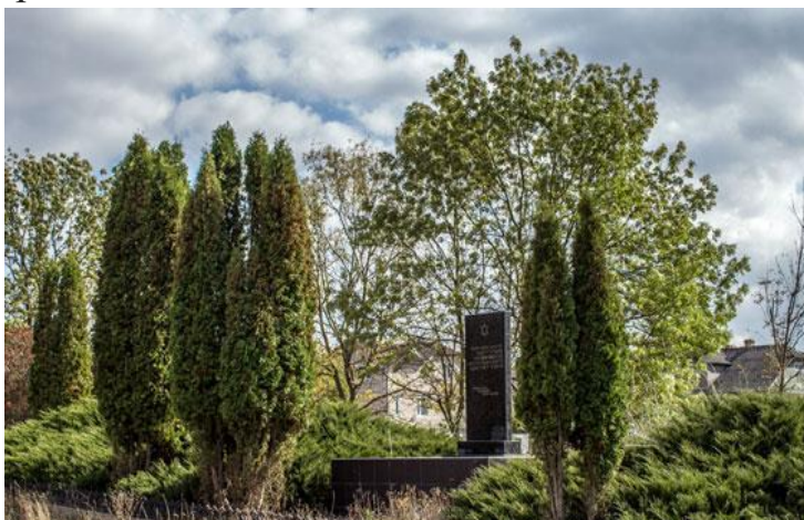
Братська могила закатованих євреїв.