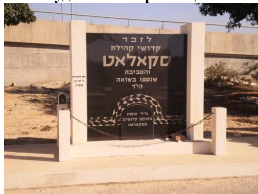
Меморіал, присвячений містянам-жертвам Голокосту (Холон, Ізраїль)