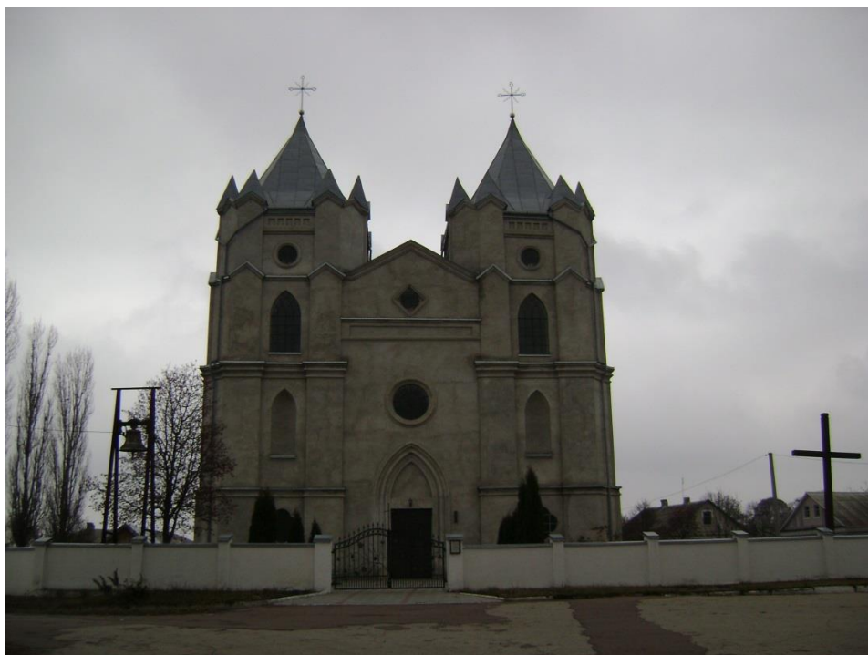
Костел Непорочного Зачаття Пречистої Діви Марії, нині Преображенська церква. 161

Після Люблінської унії 1569 року Шумськ у складі Волині потрапив під владу шляхетської Польщі. На поч. XVII ст., з 1603 року, Шумськ потрапив до Ело-Малинських. Вони володіли містечком аж до середини XVIII ст. в 1632 році Малинські побудували Троїцьку православну церкву, яка не збереглася. Один з фундаторів цієї церкви був волинський чашник Данило Малинський, який зіграв значну роль у діяльності братства у Кременці, школи та друкарні, в якій 350 літ тому, в 1638 році, було надруковано унікальний підручник української мови – Крем'янецьку граматику.