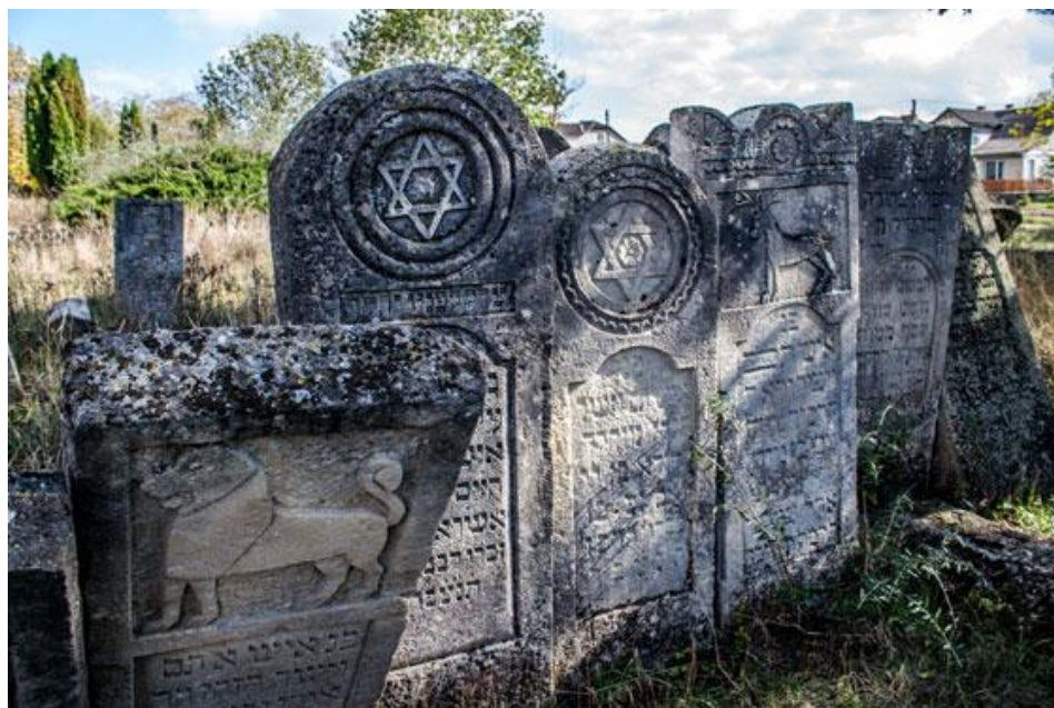
Старий єврейський цвинтар.

Крапку в історії єврейської громади Тлустого поставила німецька окупація. Нацисти створили в містечку гетто, куди крім місцевих зігнали євреїв з сусідніх Заліщків, Городенки, Ягільниці, Чорткова тощо. 27 травня та 6 червня 1943 р. у наслідок двох масових страт все населення гетто було знищене. Враховуючи страти попередніх років, в містечку на загал закатували майже 5 тис. людей.