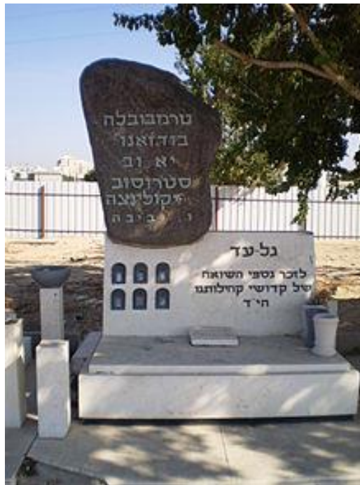
Пам'ятник євреям Тереховлі та Буданова у вигляді символічної могили у місті Холон в Ізраїлі 158

Загалом у Тереховлі було знищено понад 5 тис. осіб: 5-7 листопада 1942 р. – 1 тис. 200 осіб (1 тис. 91 особу було вивезено до «табору смерті» у Белжець, а 109 розстріляно в самому місті), 7-14 квітня 1943 р. – 1 тис. 110 осіб, 3 липня 1943 р. – 3 тис. 500 осіб у с. Плебанівка Тереховлянського району. Дітей та осіб похилого віку не розстрілювали, а кидали живцем у задалегідь підготовлені могили, після чого на них кидали трупи вбитих і засипали землею. Після ліквідації гетто 5 червня 1943 р. тут було додатково розстріляно 350 євреїв. Втекти і вижити вдалося лише кільком десяткам євреїв.