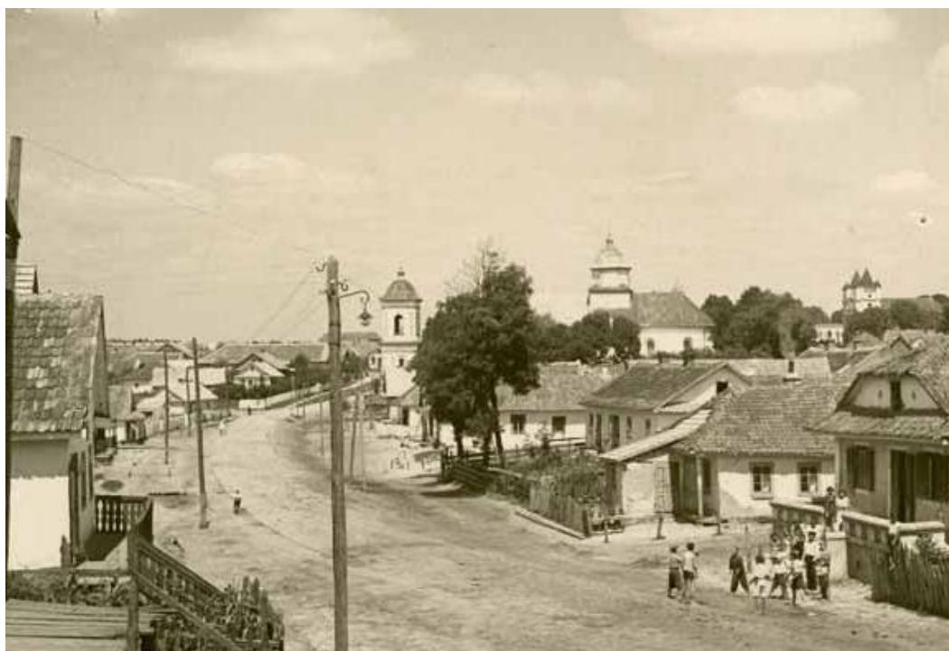
Головна вулиця містечка. 1938 р.

1939 року було відкрито лікарню на 20 ліжок, де працювали лікар, стоматолог та 5 медичних сестер. В роки німецької окупації медичне обслуговування жителів Шумська та навколишніх сіл здійснювали два лікарі, які займалися приватною практикою. Прикметно, що кілька лікарів – євреїв були врятовані з шумського гетто українським збройним підпіллям і довгий час працювали в шпиталі Воєнної округи УПА «Волинь – Південь», викладали на курсах медичних сестер. 162