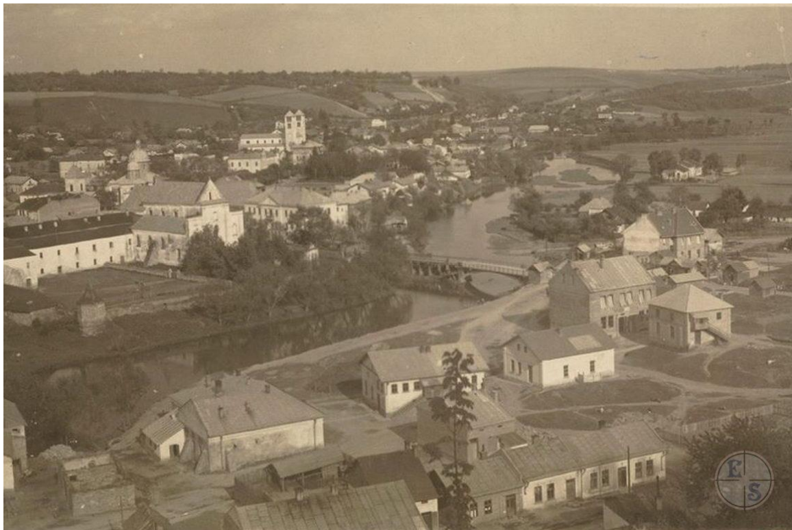
Єврейська ділянка Терешчівлі у 1930-х.