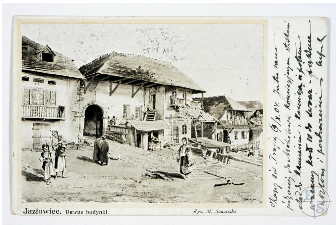
Вулиця у Язловці, малюнок поч. 20 ст.

Язловець виник у XIV ст. на шляху зі Львова до Молдови, коли магнати Бучацько-Язловецькі збудували тут замок. Тут з'являються великі вірменська та єврейська громади. Їхніми силами у XVI ст. зводяться ренесансні Вірменська церква (1551р., 1810р. перебудована на православну церкву Святого Миколая) та оборонна синагога. Язловець стає містечком, в якому проводився один із найбільших ярмарків на Поділлі. У 1519 році містечко отримало магдебурзьке право.