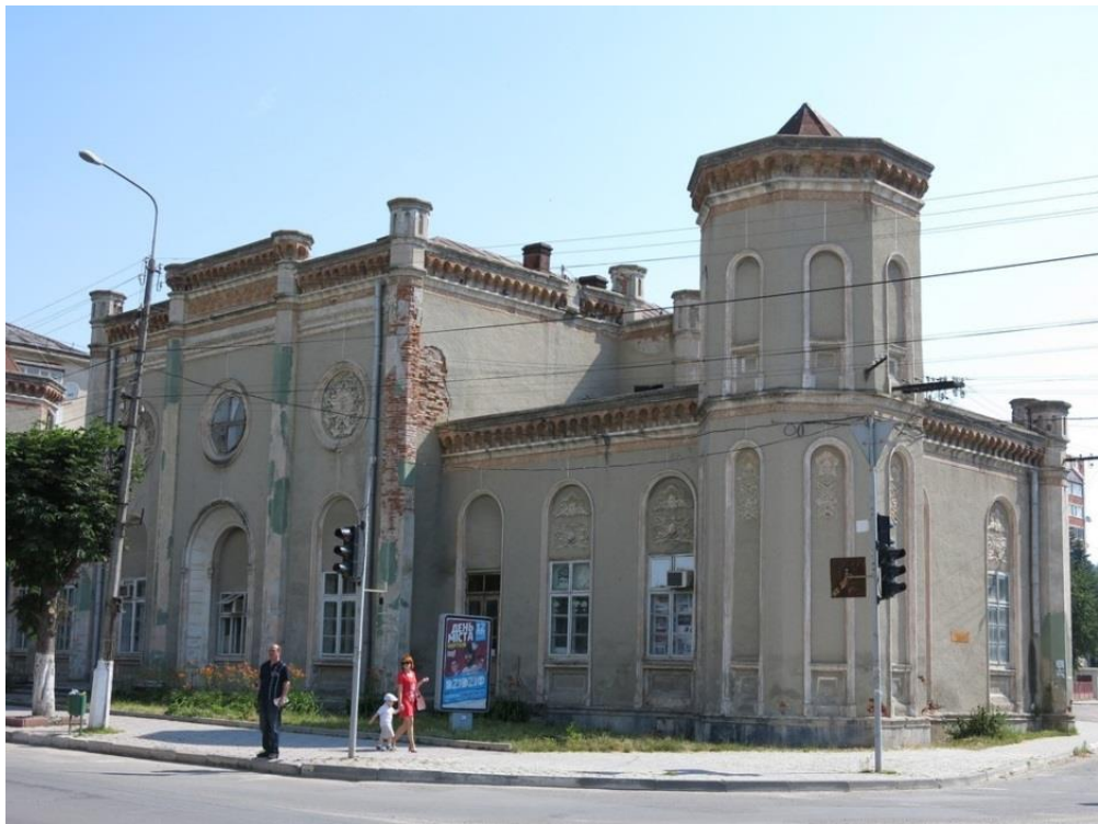
Чортків, синагога нова.

Протягом 1905–1909 рр. у Чорткові була збудована Нова синагога. Її основою став побудований раніше хасидський клойз (1870), який перебудовано у палац цадика з великим молитовним залом. Віденський архітектор Ганс Гольдкремер, який робив проект, взяв за взірець резиденцію садгірського цадика, добудувавши до клойзу флігелі з вежами в орієнтальному стилі. В радянські часи і до 2013 р. у споруді розміщувалася «Станція юних техніків».