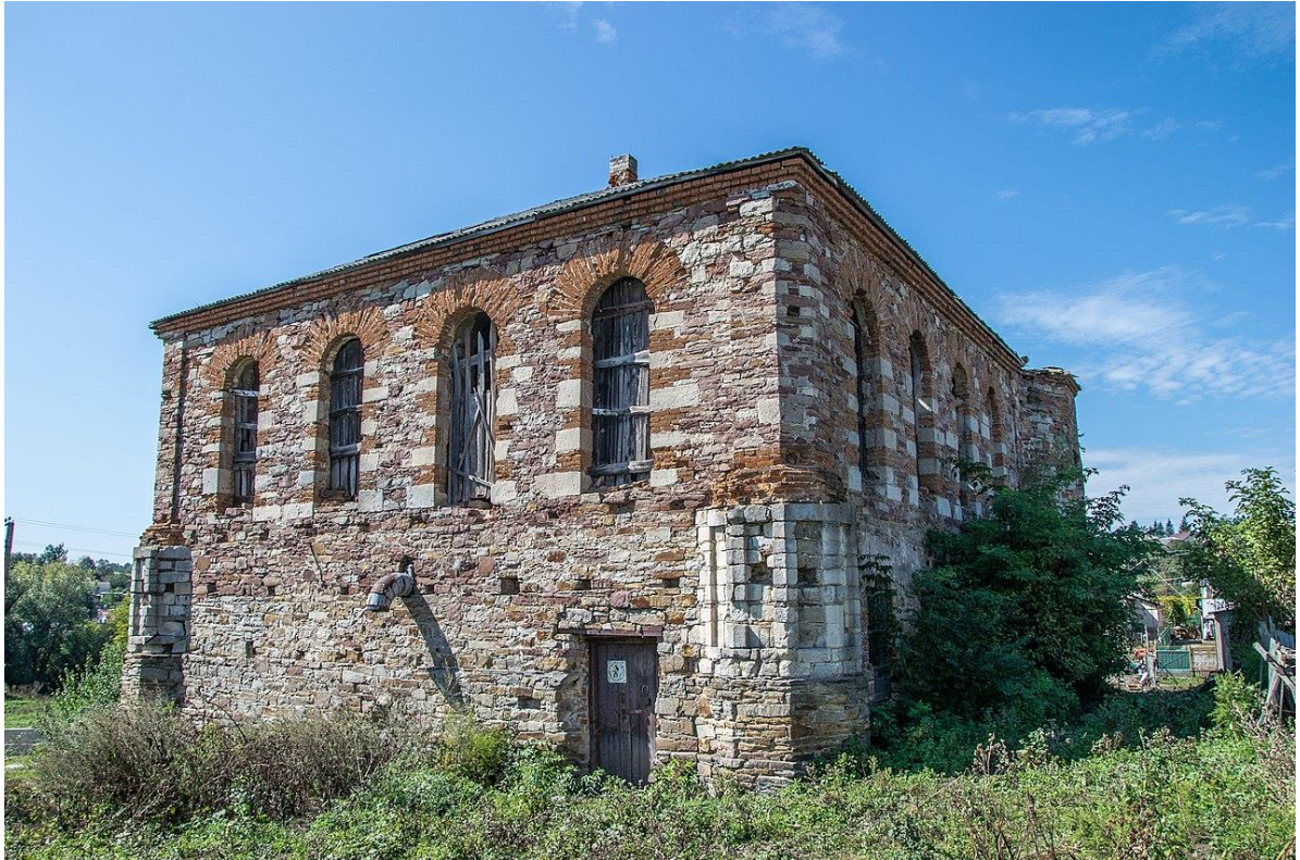
Синагога. Пам'ятка архітектури місцевого значення (XIX ст.).

В листопаді 1942 року зі Струсова було перевезено до Теробовлі єврейське населення (1900 р. кількість євреїв у містечку становила більше 700 осіб). Частина з них було вивезено до табору у місті Белжець, а інших залишили у новоствореному Теробовлянському гетто. У квітні-червні 1943 року гетто було ліквідовано.