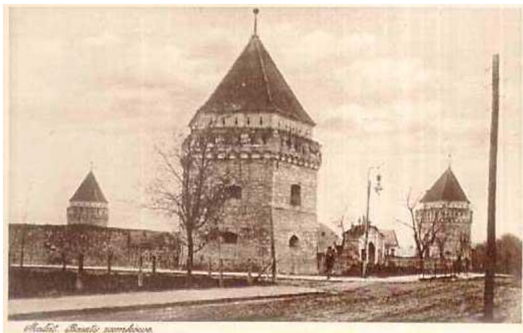
Стара листівка із зображенням замку 140

Перше документальне свідоцтво про Скалат датується 1512 роком, коли він був частиною Теревовлянського повіту Галицької землі Руського воєводства. В 1600 власники Скалата магнати Сенявські заснували нове місто, назвавши його спочатку Дембно. Цього ж року Скалат отримав Магдебурзьке право, невдовзі будується кам'яний замок. У 1766 р. магдебурзьке право міста було підтверджено грамотою короля Станіслава-Августа Понятовського.