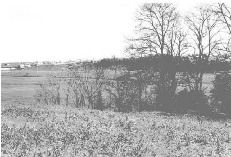
На горі Замчисько, тут відбувся Голокост 29 червня 1943 року.

В 60 роки жертв голокосту – викопали і перезаховали у кутку християнського цвинтаря. На тому ж місці спорудили ресторан „Вітерець”, пізніше перейменований в „Збруч”. В нас це місце часом називають Сінай, або Жидівська гора. У 2003 році вихідцем з Підволочиська, відомим московським продюсером Аліком Дотсманом на місці перезаховання збудований меморіал.