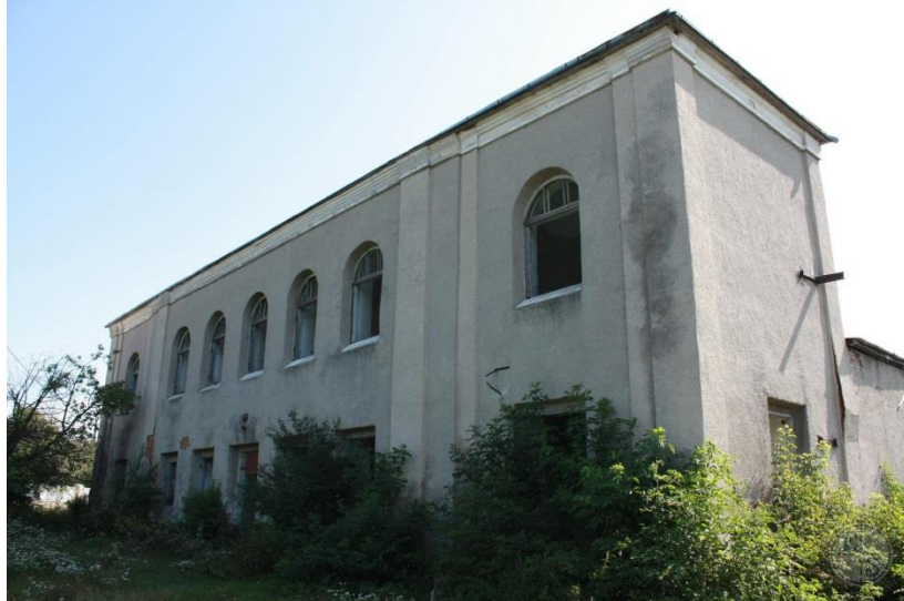
Синагога побудована наприкінці 19 ст. 2013р. 141

За деякими даними, пережило окупацію близько 160 євреїв Скалата. Сьогодні євреї тут не мешкають.