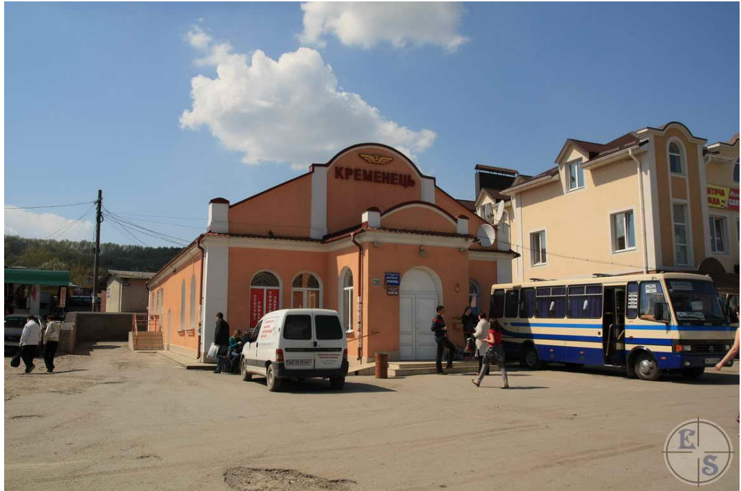
Колишня будівля синагоги, сьогодні приміщення автовокзалу.

У 16-17 ст. єврейська громада Кременця процвітала. Визначними рабинами міста в цей період були Авраам Хазан, автор «Хіббурей лекет» («Вибрані твори»), відомий галахіст раббі Мордехай Яффе та раббі Шімшон бен Бецалель.