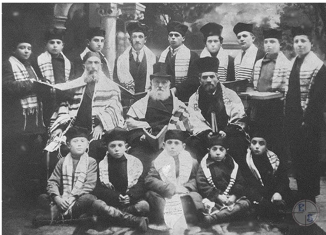
Хор синагоги.

У 1931 р. єврейське населення Кременця налічувало 7256 осіб (36% від населення).