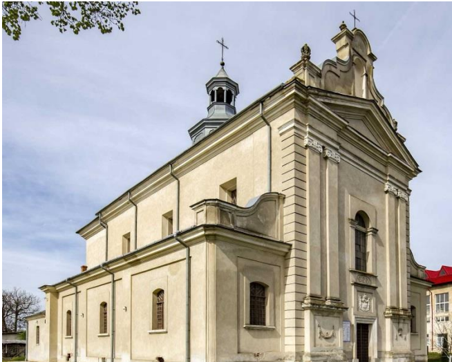
Костел Успіння Діви Марії