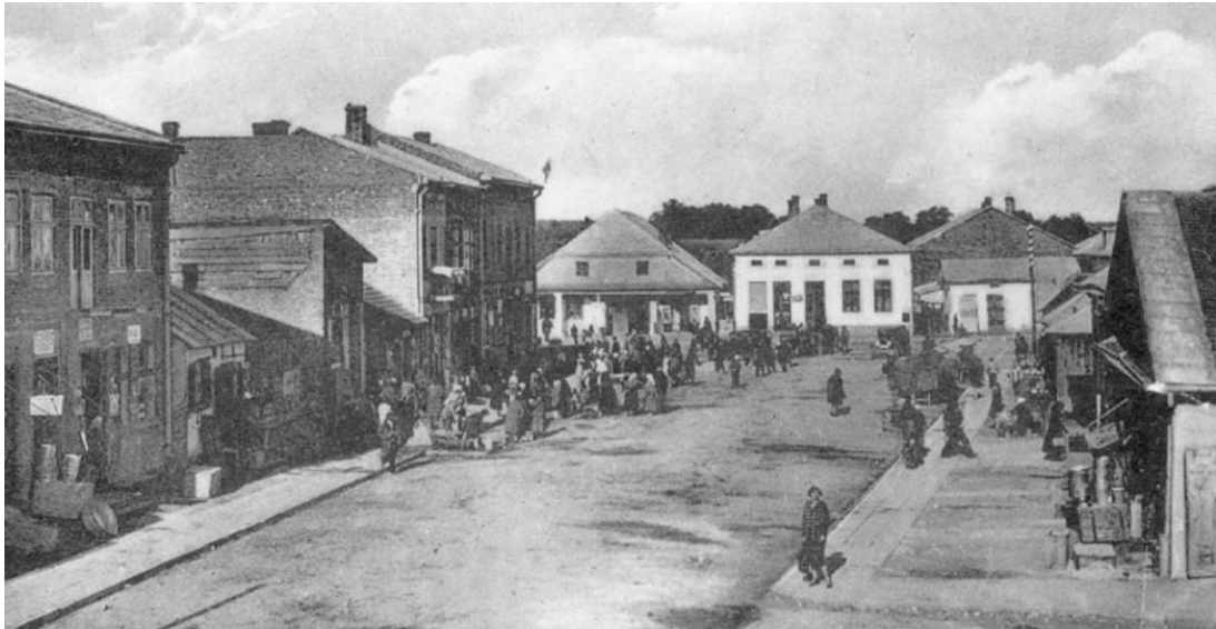
Копичинецький ринок. Фото 11.02.1911 р.

У 1772 році в результаті першого поділу Речі Посполитої Копичинці перейшли до Австрії.