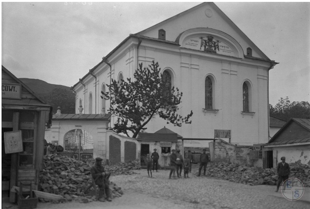
Велика синагога. Фото експедиції Ан-ського, 1912р.

розстрілювали. Нерегулярно, з великим обмеженням, людям видавали сурогатний хліб. Часто їм не вистачало питної води. На початку існування гетто євреї нелегально торгували з місцевими мешканцями через дірки у стіні, згодом німці це суворо заборонили. Щоденно тут помирало близько 10-12 осіб.