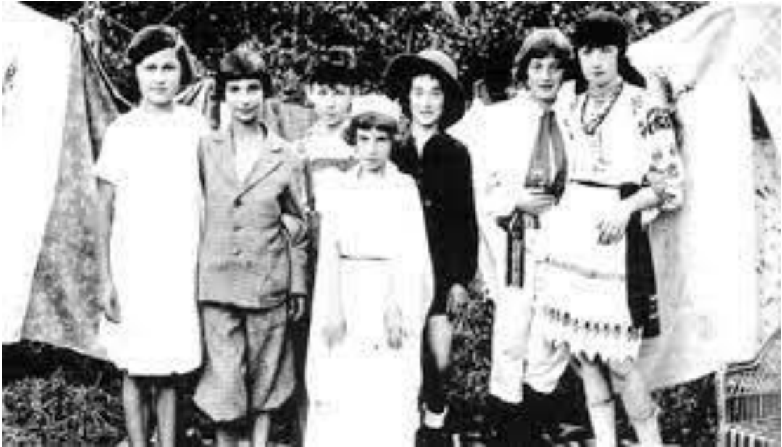
Єврейські та українські діти на забаві. м. Ланівці 1930 р.