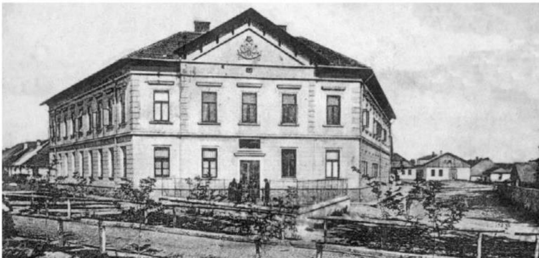
Будинок повітового суду 1928 р.

З 1809 року Копичинці відійшли до складу Росії в результаті підписання 1807 році Олександром I Тильзитського миру з Наполеоном. У 1815 році Копичинці перейшли знову до Австрії в результаті Віденського конгресу.