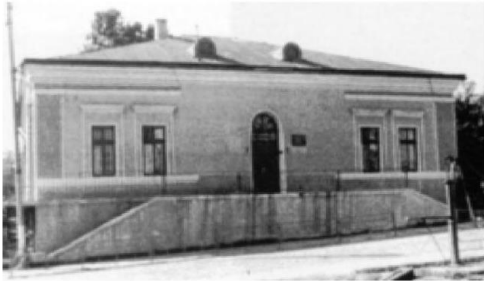
Будинок єврейської гмінни

Від 1921 року за Ризьким договором у складі Польщі, де Копичинці стали центром повіту Тарнопольського воєводства.