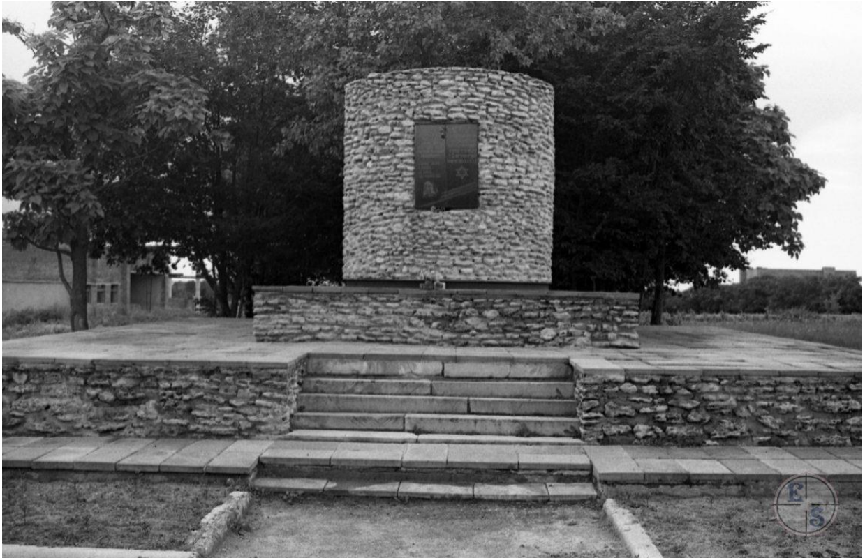
Пам'ятник на братській могилі.

було розстріляно близько 600 осіб з мирного населення. Пережити Голокост вдалося лише 14 євреям.