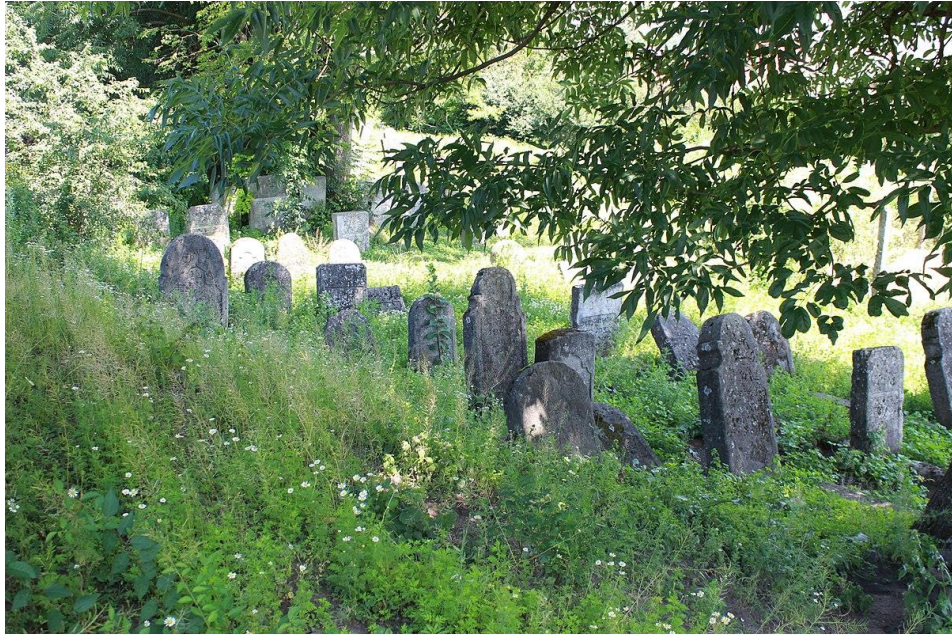
Єврейське кладовище, м. Ланівці, вул. Гайова. 123