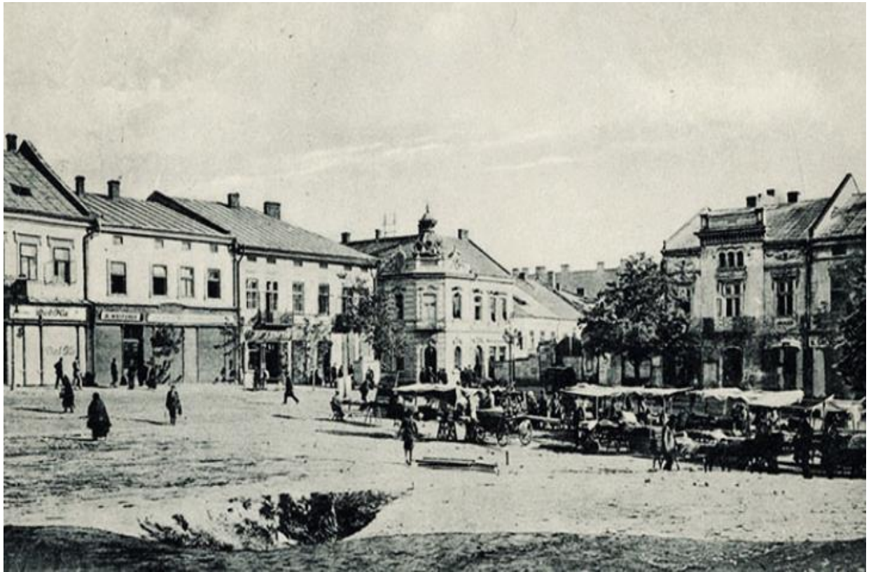
Головна площа Дрогобича, 1920 р. 3

Дрогобич 1 – місто в Дрогобицькому районі Львівської області Адміністративний центр Дрогобицького району і Дрогобицької міської громади. У 1939-1941 і 1944-1959 роках – центр Дрогобицької області. Місто засноване наприкінці XI століття. Було центром староства Перемишльської землі. З XV століття місто розвивалося, як, передовсім, ярмарковий і солеварний центр. Після Першого поділу Польщі Дрогобич відійшов до Імперії Габсбургів. У середині XIX століття перетворився на найбільший у Європі нафтовий центр, що сприяло швидкому розвитку міста. З початку листопада 1918 – повітовий центр у складі ЗУНР, після Акту Злуки 22 січня 1919 – у складі ЗОУНР. Після анексії Польшею – центр повіту Львівського воєводства у міжвоєнній Польщі. 2 За Пактом Молотова-Ріббентропа 1939 року анексований Радянським Союзом.