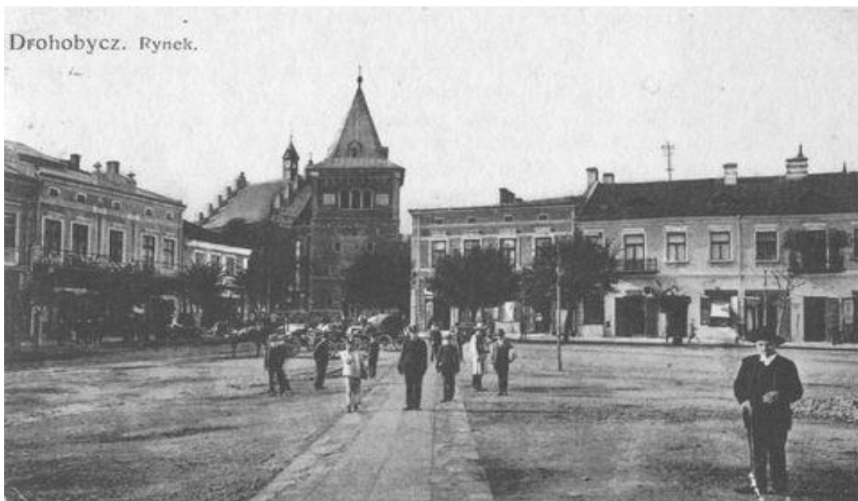
Ринок у Дрогобичі до Першої світової війни. Справа від собору — будинок Шульців, де народився Бруно і де була крамниця його батьків.

Попри посмертну світову славу, що за рівнем не поступається патріархам європейського модернізму – Марселю Прусту та Францу Кафці, за життя Бруно Шульц затятим мандрівником не вважався. Найвіддаленіші місця, які ненадовго митець відвідував, були Франція та Швеція. Більшу