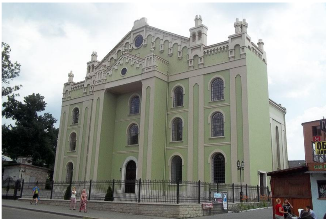
Дрогобицька хоральна синагога, 2018 р. 6

Західна Україна була приєднана до Радянського Союзу лише у вересні 1939 року. Можливо, двадцятирічний розрив у часі від початку руйнування та переробки культових будівель комуністичним режимом на Східній Україні та інших регіонах Радянської Росії дозволив зберегти в Галичині значно більшу кількість єврейських пам'яток. Завдяки цьому сучасні дослідники мають можливість вивчати історію будівництва синагог не лише за малюнками та фотографіями, а й за пам'ятками єврейської архітектури, що збереглися в Західній Україні. Значна кількість синагогальних будівель – 8 з 20, що існували перед Другою світовою війною, включаючи найбільшу синагогу Західної України, – збереглася у місті Дрогобичі прикарпатського.