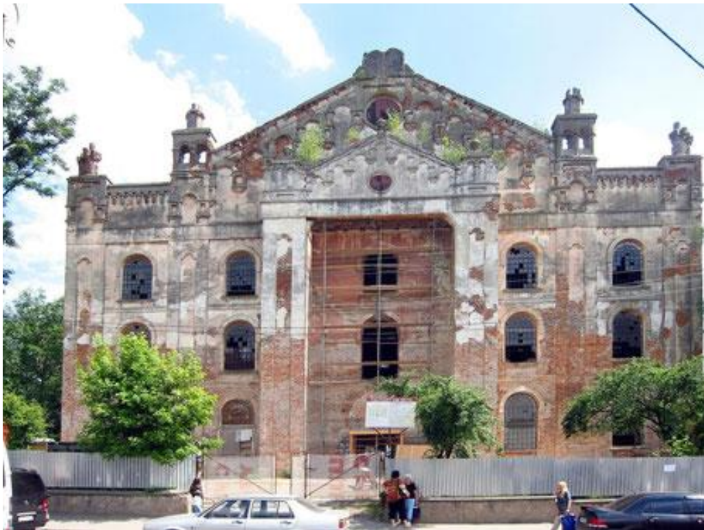
Дрогобицька хоральна синагога, 2014 р.

Найбільшу синагогу Східної Галичини свого часу малював видатний художник, “єврейський Рембрандт” Маурицій Готтліб. Він був однокласником і товаришем Івана Франка, а живопису вчився у самого Яна Матейка. Дрогобицьку хоральну синагогу він також зобразив на своїй картині “Синагога в Йом Кіпур”.