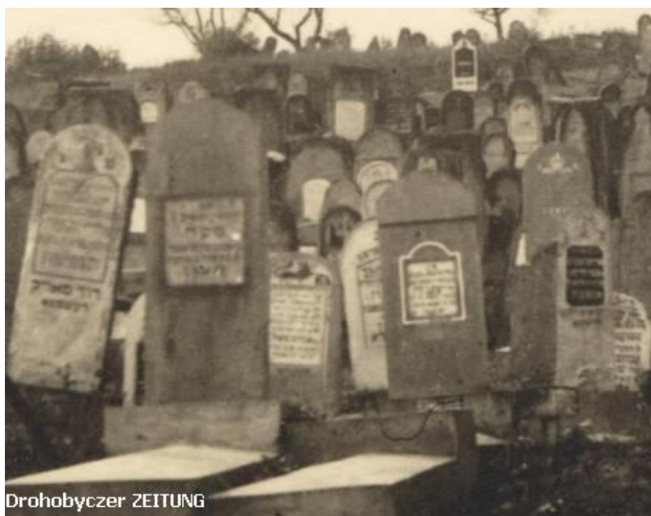
Єврейський цвинтар у Дрогобичі, 1942 р.

початку XVIII століття і знаходився на території єврейського кварталу Лан. Новий єврейський цвинтар був відкритий у 20-х роках.