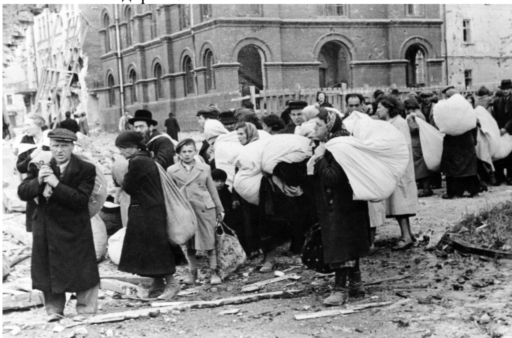
Мешканці гетто в Дрогобичі очікують депортації, 21 липня 1941 р. 18

Антисемітська політика нацистської адміністрації, перш за все, проявлялась у сегрегації єврейського населення. Ще під час захоплення Польщі, 21 вересня 1939 року, начальник головного управління імперської безпеки (з нім.– Reichssicherheitshauptamt, далі – РСХА) Рейнгард Гейдріх видав “термінову депешу” (Schnellbrief). Це були перші інструкції щодо ставлення до євреїв, які проживали на окупованих територіях. Концентрація єврейського населення передбачалась у великих населених пунктах неподалік залізничної дороги. 17