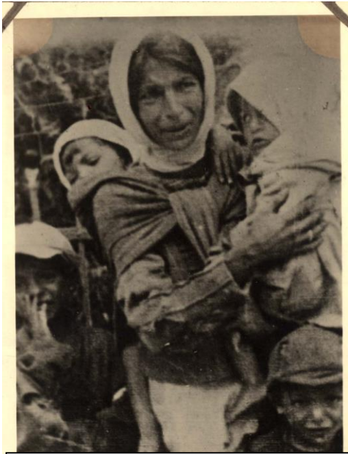
Дрогобич, єврейка та четверо дітей на збірному пункті перед депортацією.

Дрогобич «чистим від євреїв». Після приходу Червоної армії у серпні 1944 р. бл. 400 євреїв вийшли зі своїх схованок. Вони змогли пережити Голокост у тому числі завдяки допомозі небайдужих українців і поляків.