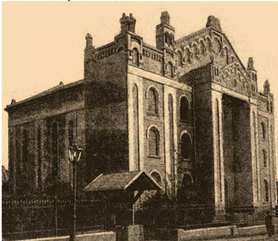
Так синагога виглядала на початку XX століття

Саме на території колишнього Лану у старій частині міста, у межі сучасних вулиць Малий Ринок, 22 січня, Лесі Українки та Пилипа Орлика на останній і стоїть знаменита хоральна синагога. На відміну від багатьох інших дрогобицьких синагог, в кожен з котрих ходили представники певного стану, хоральна відчиняла двері для всіх юдеїв міста.