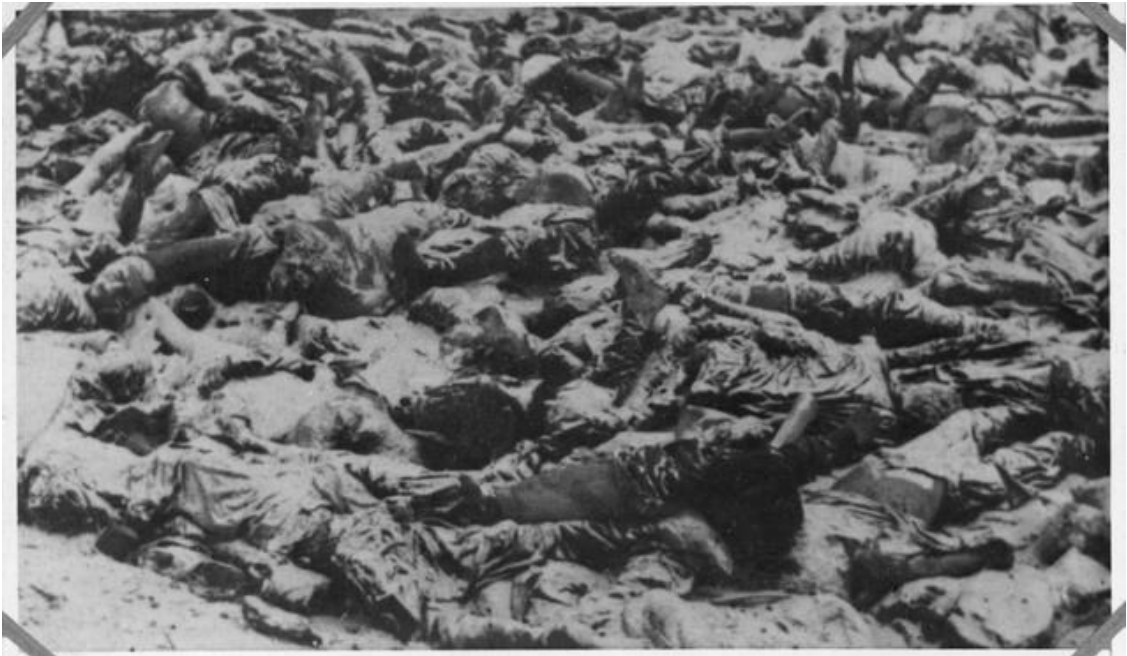
Дрогобич. Трупи у відкритій братській могилі, 1944-1945рр. 19