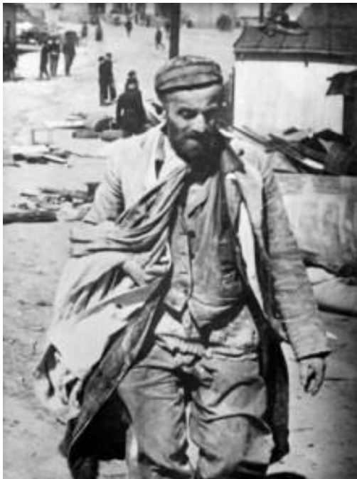
Єврей з Дрогобицького гетто

Ліквідацію Дрогобицького гетто розпочато у травні 1943 року. 21 травня та 22 травня нацисти знищили хворих з єврейського шпиталю. Зі спійманих 735 юдеїв 30 розстріляно, 705 відправлено до Львова. 4 червня нацисти знову почали декого з євреїв розстрілювати на місці. Решту вивозять до Броницького лісу, примушують роздягнутися та знищують групами кількістю від 6 до 10 осіб. Ховають у викопаних розрахованих на 200—300