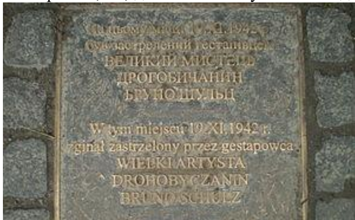
Пам'ятна плита на місці загибелі Бруно Шульца.

Дорогою додому, до одноповерхового будиночка на вулиці Столярській, 18, де його сім'я тулилася в одній кімнатці, маляр потрапив під