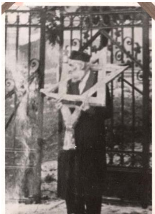
Єврей із зіркою Давида на шії. Дрогобич, 1941-44 рр.

Значна частина євреїв була знищена в період із серпня по листопад 1942 року, зокрема вивезена поїздами Голокосту до винищувального табору Белжець. 15 липня 1943 р. окупаційні влади проголосили