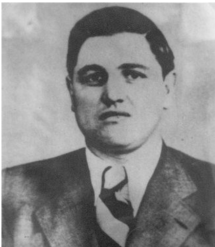
Шеф дрогобицького гестапо, гауптшарфюрер СС Фелікс Ландау.

З приходом німецьких військ в Дрогобич Бруно Шульц розділяє долю усіх дрогобицьких євреїв, переселившись до гетто. На його щастя, художник